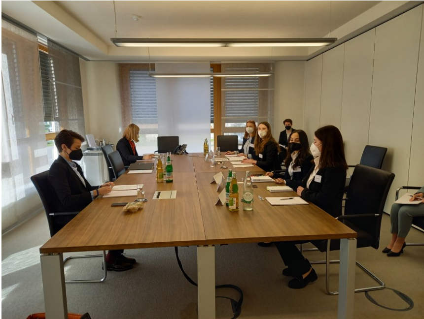
Das Schiedsgericht Isenburg beim Kümmerlein Pre-Moot 2022