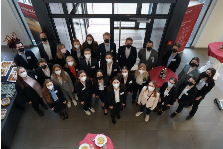
Die Teilnehmerinnen und Teilnehmer des Kümmerlein Pre-Moot 2022