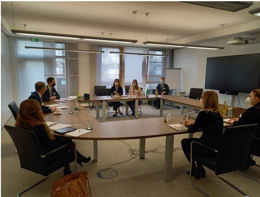
Das Schiedsgericht Zollverein beim Kümmerlein Pre-Moot 2022